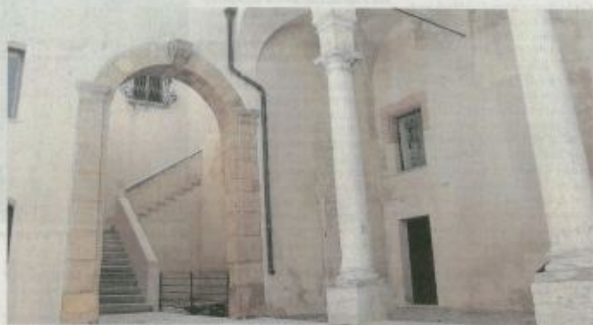
L'interno di Palazzo Grignani

l'epopea garibaldina. A riguardo, particolarmente interessante è anche la saletta che riporta le varie Compagnie che presero parte alla Spedizione dei Mille, contenente anche la sezione dedicata al "Mito" di Garibaldi. Ed ancora, il busto marmoreo dell'eroe, eretto in piazza dello Vittoria, l'antica "Porta Nuova" che si affaccia sul Parco archeologico; la Sala Garibaldi allestita con armi e cimeli nelle Cantine Flauto dove il Generale si fermò a degustare il vino Marsala, preferendo quello nella tipologia dolce, nella sua seconda visita a Marsala, il 19 luglio 1862; il Monumento ai Mille, un "lino" ai garibaldini giunti a Marsala. Tracce delle 1089 camicie rosse sono riportate sulle due muraie di questa "nave" composta da due poppe (una del Piemonte, l'altra del Lombardo) che confiniscono su di un'unica prua. È un nuovo centro culturale ed avrà in "stiva" un info point per l'accoglienza turistica.