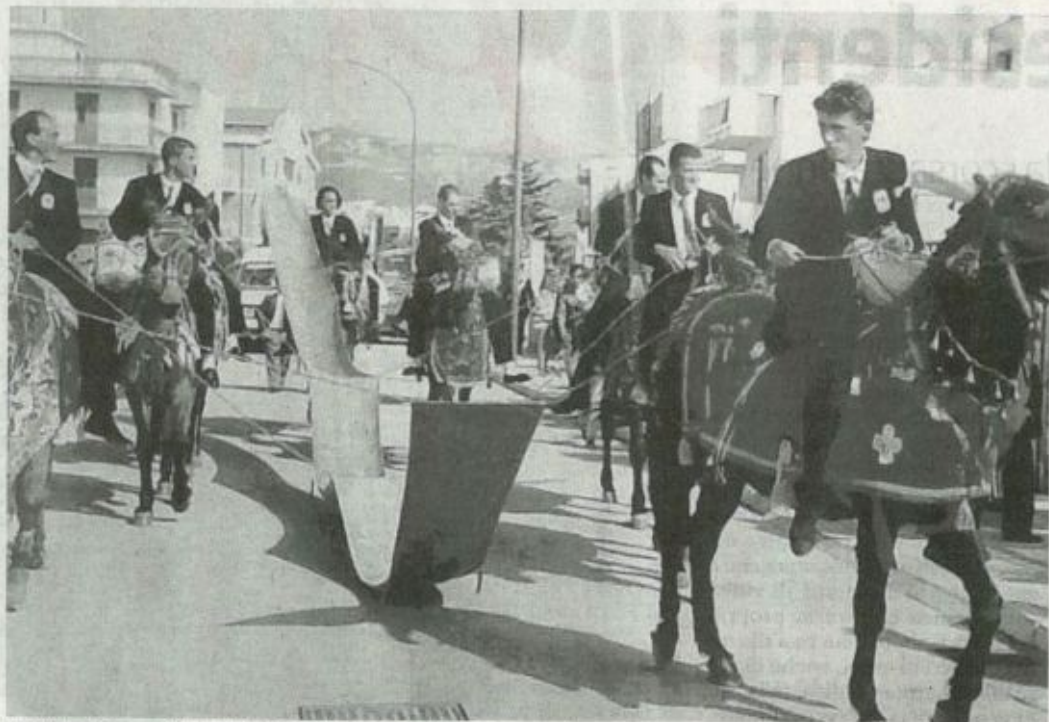
Una foto d'epoca della «Festa Ranni»

●●● La "festa ranni" (grande festa) la kermesse culturale e folkloristica secolare che abbraccia tradizione popolare e devozione religiosa ritorna ad essere nuovamente in primo piano grazie alla volontà della "Congregazione del Santissimo Crocifisso" di Gibellina e alla collaborazione del Comune. Dopo 13 anni dall'ultima edizione, rivive un'altra volta una antica manifestazione nata, secondo la leggenda agli inizi del 1500 quando in mezzo ad un torrente nelle campagne tra Gibellina e Santa Ninfa avvenne il ritrovamento di un Crocifisso ligneo. Svariate furono le discussioni per capire in quale paese si dovesse essere posto il Crocifisso, alla fine a decidere furono dei buoi che, carichi del grande Crocifisso, si diressero verso le porte di Gibellina e si fermarono lì dove oggi sorge la Chiesa di Santa Caterina. L'ultima festa nella Gibellina vecchia avvenne nel 1966, mentre nella Gibellina nuova si è svolta raramente, rispettivamente negli anni 1987, nel 1992 e 2003. Attesa dalla popolazione, la manifestazione avrà inizio oggi e si articolerà in tre giornate ricche di appuntamenti. I festeggiamenti prenderanno il via alle ore 18, con la cerimonia di "intronizzazione" del Simulacro del Crocifisso all'altare della Chiesa Ma-