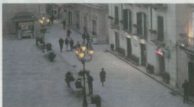
Il centro storico di Marsala