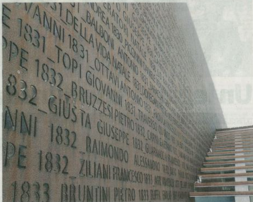
Uno scorcio del monumento ai garibaldini con incisi i nomi di tutti i componenti della spedizione

Anche perché Marsala è sinonimo di storia. Tutto ha inizio con i Fe-